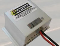
Carregador Bat. veicular # 80561