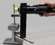
Adaptador Pistola # 910151